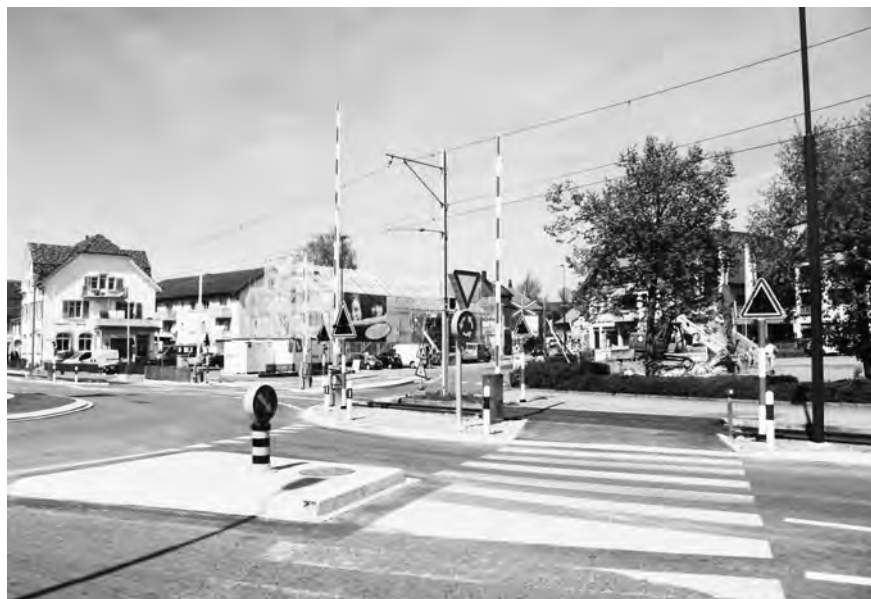
Neuer Kreiselsicherung in Wängi

Im vergangenen Jahr wurden 4.5 km Gleis maschinell gekrampt und die Befestigung sowie die Eindeckung der Bahnübergänge wo nötig ersetzt. Zudem sind 5 km Gleis geschliffen worden. Beim Ersatz von Weichenzungen wurde festgestellt, dass bei allen aufschneidbaren Weichen unpassende Zungen vorhanden sind. Diese sind im kommenden Jahr zu ersetzen. Sämtliche Weichen wurden ausserdem durch eine Drittfirma elektrisch und mechanisch geprüft und gewartet. Weiter wurde in Matzingen der Hauptstrassen-Bahnübergang Stettfurterstrasse saniert und beim Übergang Ruggenbühlstrasse der Oberbau sowie gleichzeitig 150m Gleis erneuert. Wiederum haben alle Dienste der Abteilung Infrastruktur ihre jährlichen Unterhaltsaufgaben und Kontrollen durchgeführt.