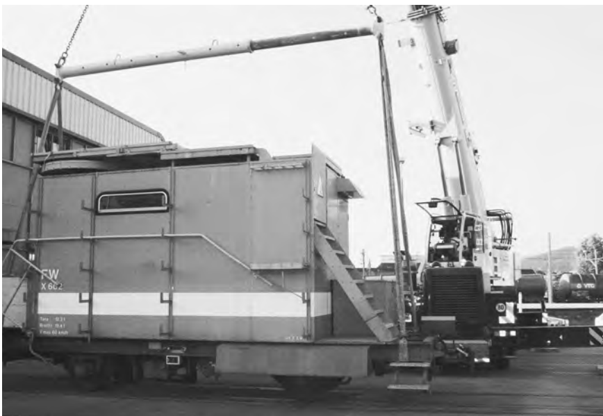
Verlad des Turmwagens