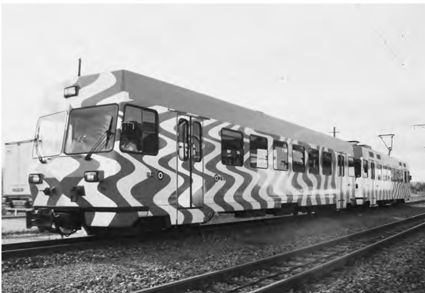
Die Frauenfeld-Wil-Bahn in voller Fahrt