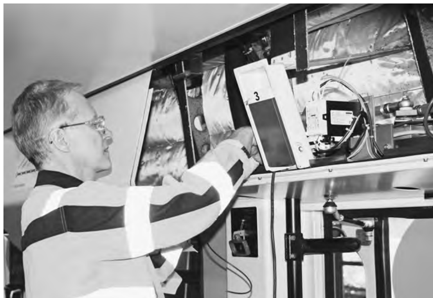
Einbau des automatischen Fahrgastzählsystems in der Werkstatt Wil

Für den pflichtbewussten Einsatz sprachen der Verwaltungsrat und die Direktion allen Mitarbeitenden den verdienten Dank aus. Dies erfolgte finanziell in Form einer allgemeinen Lohnerhöhung von 0.9 % auf den 1. Januar 2010, welche zusammen mit dem letztjährigen Lohnverzicht von 1.5 % für die Sanierung der beruflichen Vorsorge eingesetzt wird.